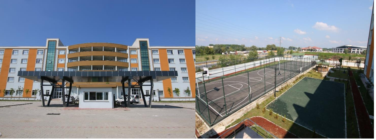
Şekil 2. KYK Yurdu

Akyazı Sağlık Hizmetleri Meslek Yüksekokulu Yerleşkesine 3 km mesafede Kredi Yurtlar Kurumu'nun (KYK) 500 kişilik öğrenci yurdu bulunmaktadır.