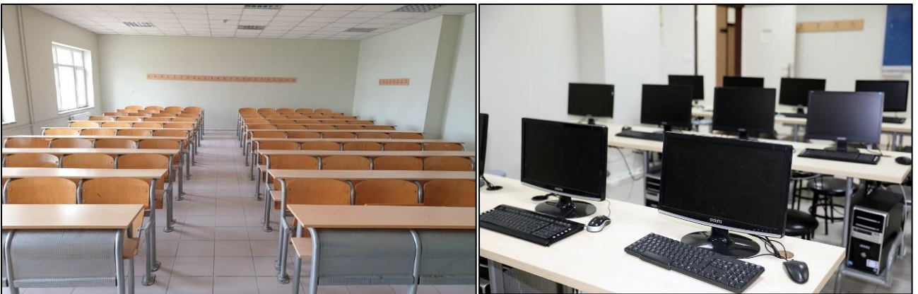
Şekil 3. Derslik ve laboratuvarlarımız

Okulumuzda 12 adet derslik, 1 adet bilgisayar laboratuvarı ve 3 adet sağlık laboratuvarı bulunmaktadır.