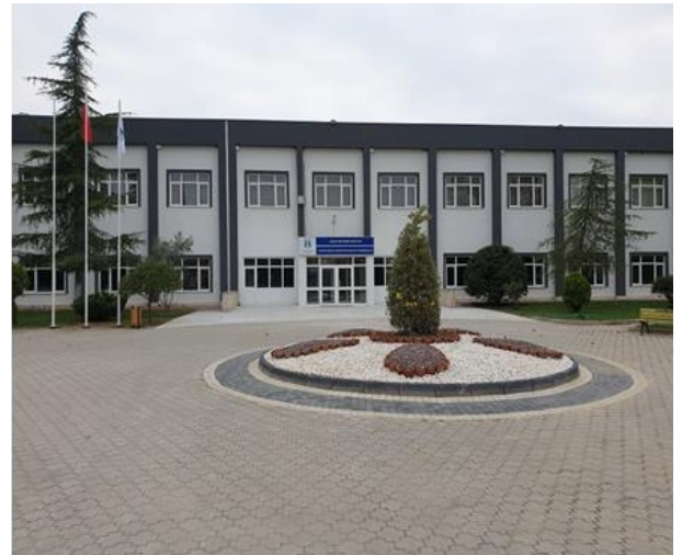
Şekil 1. MYO Yerleşkemiz