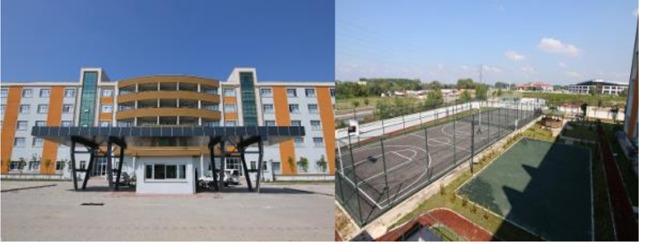
Şekil 2. KYK Yurdu

Akyazı Sağlık Hizmetleri Meslek Yüksekokulu Yerleşkesine üç kilometre mesafede Kredi Yurtlar Kurumu'nun (KYK) 500 kişilik öğrenci yurdu bulunmaktadır.