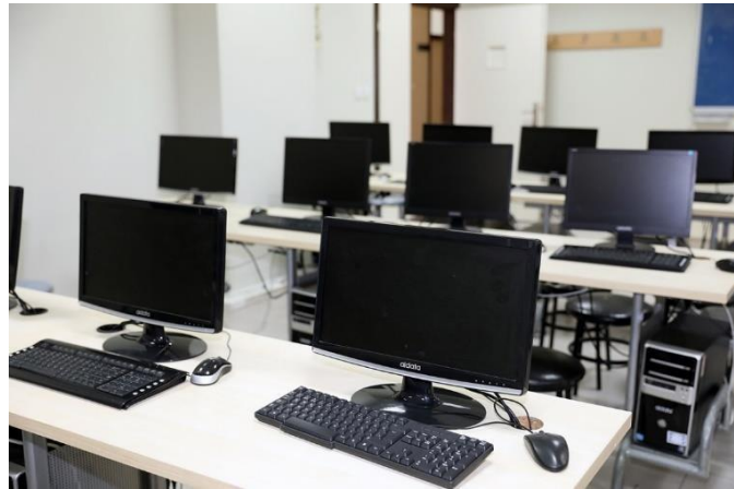
Şekil 4. Laboratuvarlarımız