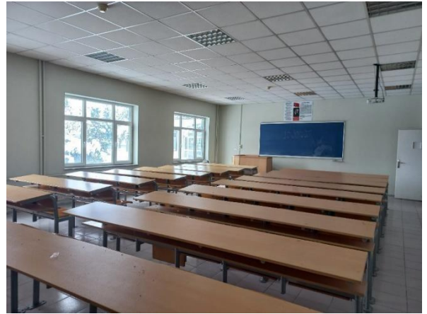
Şekil 3. Derslikler