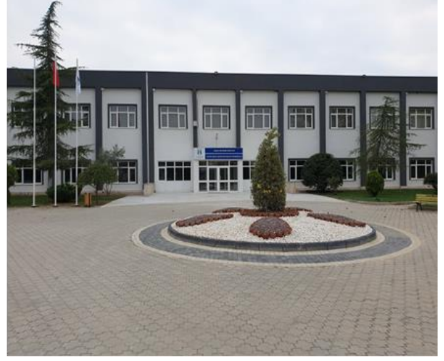
Şekil 1. MYO Yerleşkemiz