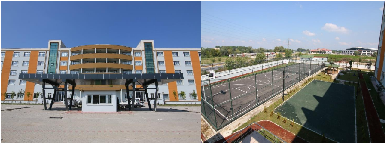
Şekil 2. KYK Yurdu

Akyazı Sağlık Hizmetleri Meslek Yüksekokulu Yerleşkesine 3 km mesafede Kredi Yurtlar Kurumu'nun (KYK) 500 kişilik öğrenci yurdu bulunmaktadır.