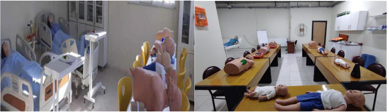
Şekil 4. Derslik ve Laboratuvarlarımız