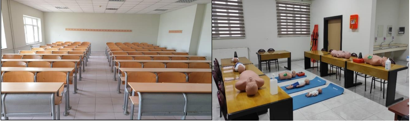
Şekil 3. Derslik ve Laboratuvarlarımız

Okulumuzda 12 adet derslik, 1 adet bilgisayar laboratuvarı (30+1 bilgisayar kapasiteli) ve 4 adet sağlık laboratuvarı bulunmaktadır.