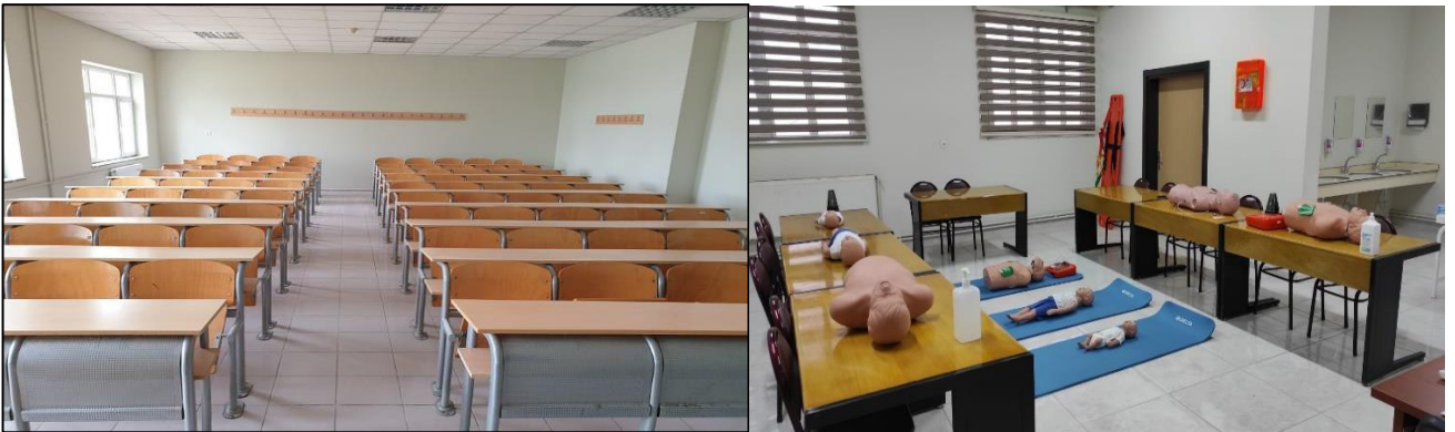
Şekil 3. Derslik ve Laboratuvarlarımız

Okulumuzda 12 adet derslik, 1 adet bilgisayar laboratuvarı (30+1 bilgisayar kapasiteli) ve 3 adet sağlık laboratuvarı bulunmaktadır.