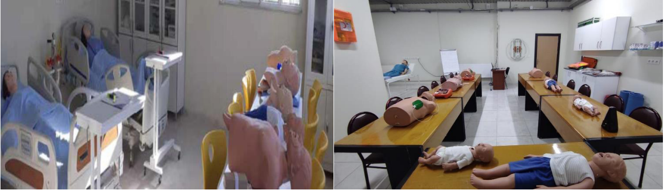
Şekil 4. Derslik ve Laboratuvarlarımız