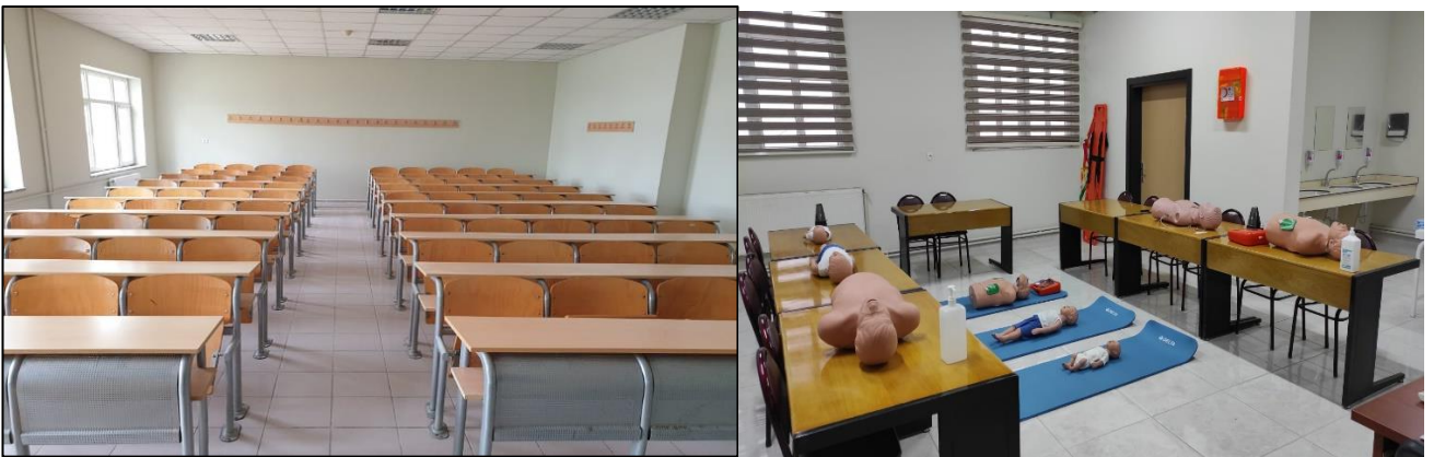
Şekil 3. Derslik ve laboratuvarlarımız

Okulumuzda 12 adet derslik, 1 adet bilgisayar laboratuvarı ve 3 adet sağlık laboratuvarı bulunmaktadır.