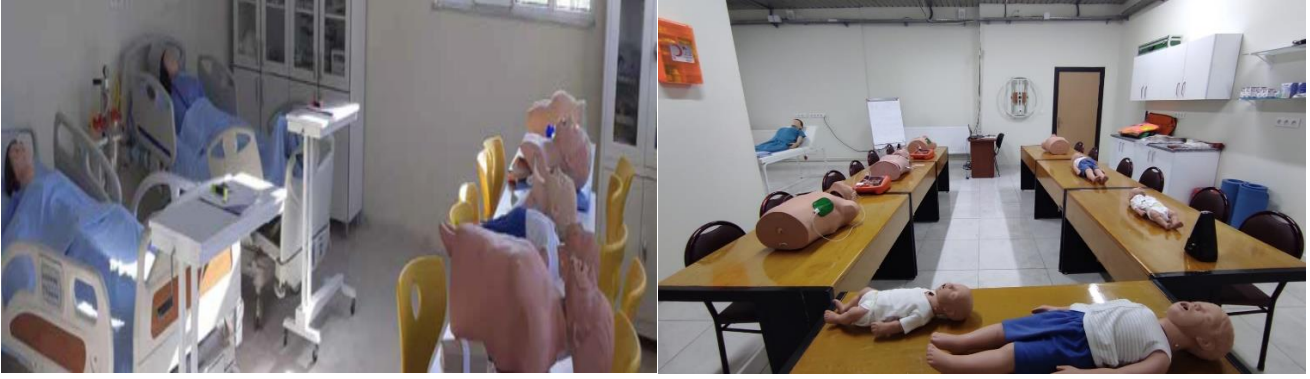
Şekil 4. Derslik ve laboratuvarlarımız